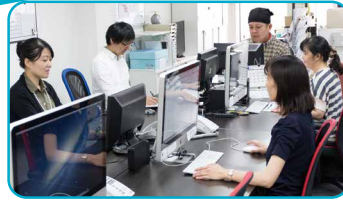
セキュアな環境がお客さまとの信頼につながる